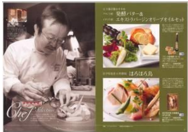
“味・粹彩(あじ・すいさい)”コース 中面画像

本リリースに関するお問い合わせは シャディ株式会社 広報・インターナルコミュニケーション部 (川端・山本) 〒105-0004 東京都港区新橋6丁目1-11 ダヴィンチ御成門ビル TEL 03-5400-5668(直通) / FAX 03-5400-5669