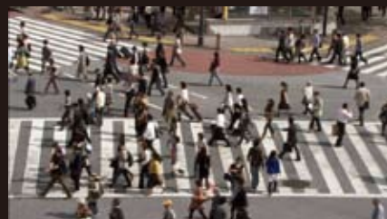
人波あふれる交差点も…