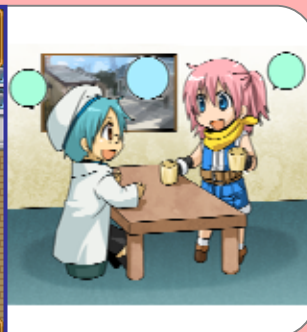
マイハウスは君だけの秘密基地

街中や冒険中に話すセリフは、自分だけのオリジナルセリフに変更可能！君は思わず爆笑してしまうお笑い系？それともなりきりヒーロー系？