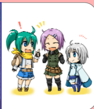
友達登録・メッセージ交換