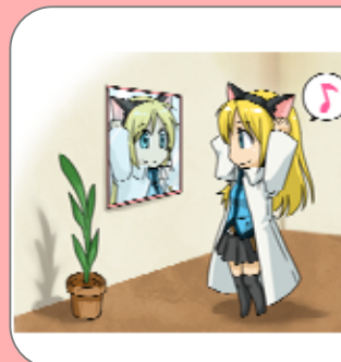
ゲーム内で個性を演出！

自分の分身である「アバター」は、髪型や服装、色などの組み合わせが全部で7000通り以上！ + アクセサリー装着で無限大の組み合わせに！かわいいディフォルメキャラクターを自分好みにアレンジしよう！