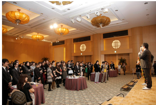
当日は10位以内に入賞した約80社の代表者150人が招待されました