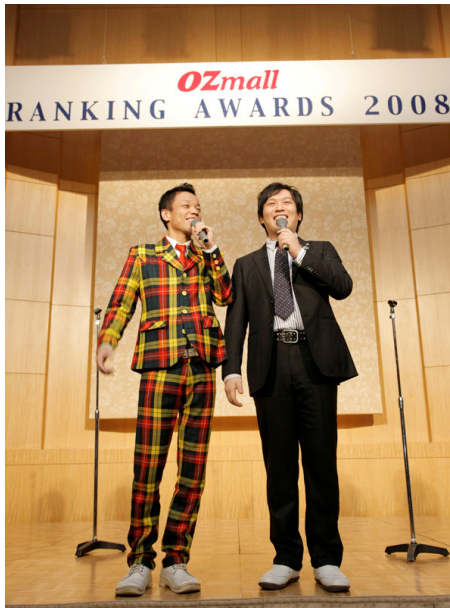
サプライズスペシャルゲストの「COWCOW」登場

また“OZmallランキングアワード2008”の発表に先駆け、2008年2月10日(火)にパンパシフィック横浜ベイホテル東急にて表彰式を開催いたしました。