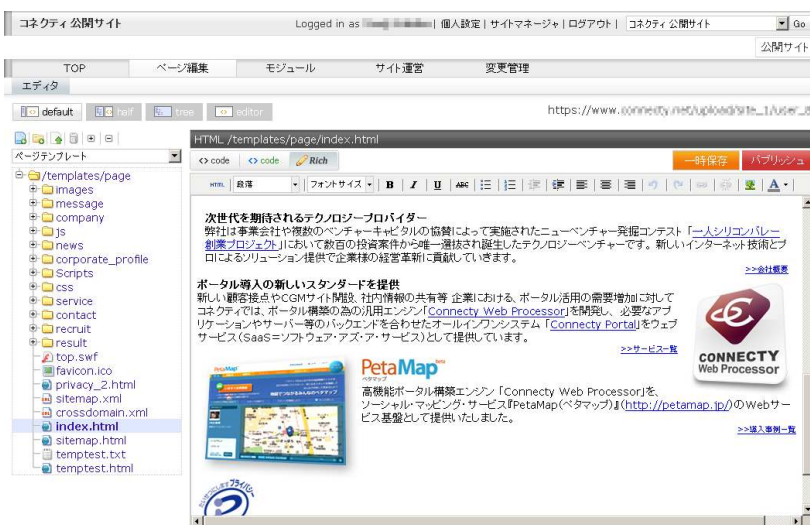
リッチエディターによる編集イメージ