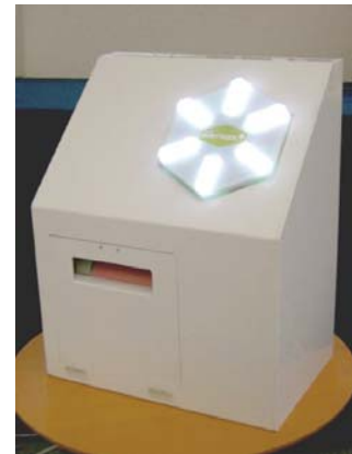
アドモバ発券機本体

以上のご意見を踏まえ、アドアーズは遊んだことのないゲームに触れる機会をご提供し、気になるゲーム・マシンでの新たな発見・驚きを感じていただきたいとの願いから本サービスを開始いたします。