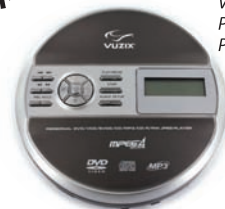
Vuzix Screenless Portable DVD Player

Vuzix ポータブルDVDプレイヤーはすべてのビデオアイウェア・Wrapシリーズでみるために理想的につくられています。内蔵モニターを装備しないことで軽量化を実現し、録画した地デジ番組をみるためのCPRMにも対応しています。モバイル環境において、DVDをみるには欠かせないものになります。