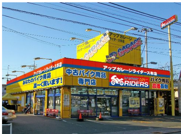
※ 写真はイメージです

なお、アップガレージライダーズ本店は、4 月 9 日（金）に移転グランドオープンいたします。 移転の詳細は別紙をご覧ください。