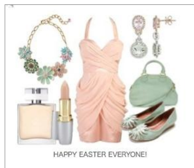
MY スタイルブック イメージ

ShopStyle 内で紹介されている商品と、ユーザーが保有する画像とを組み合わせ、自由にデザインやカラーリングしてコーディネートを作成するツールです。MY スタイルブックは SNS 機能を持っており、ShopStyle 内で他のユーザーとコメントの受発信などを行うことも可能です。また、ツイッターでつぶやいてコーディネートを紹介することもできます。