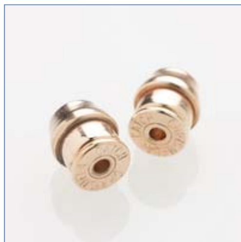
全長約5mmの内部は、0.01mmの誤差も許されない、9個の精密部品で構成させています。 特許第4167703号、特許第4560588号

「クリスメラキャッチ」は、0.6mm～1.1mmまでの太さのピアスに全て使え、保持力のテストでも8Kgの結果を出し、“外れにくい万能ピアスキャッチ”として、2008年8月販売を開始しました。