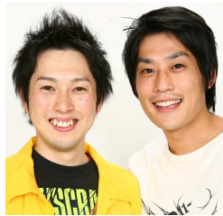
フルーツポンチ (N/V芸人)