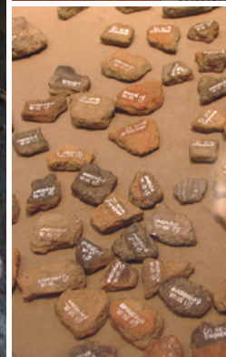
注記のある土器片(陸前高田市)