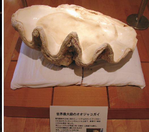
世界最大級のオオジャコガイ